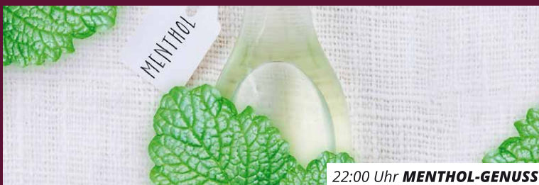
22:00 Uhr MENTHOL-GENUSS