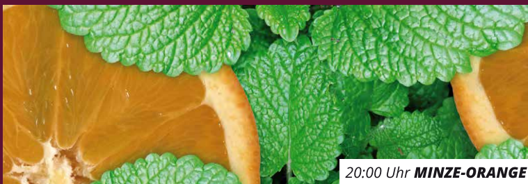
20:00 Uhr MINZE-ORANGE