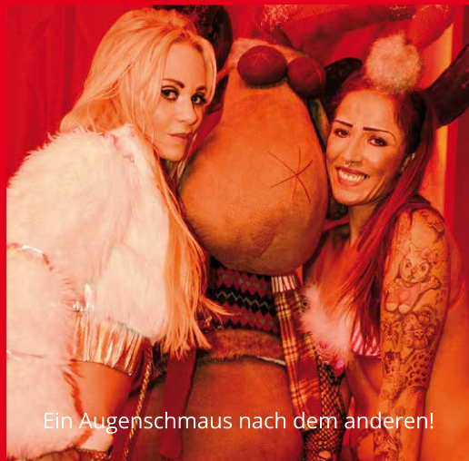
Ein Augenschmaus nach dem anderen!