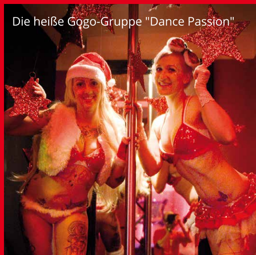
Die heiße Gogo-Gruppe "Dance Passion"