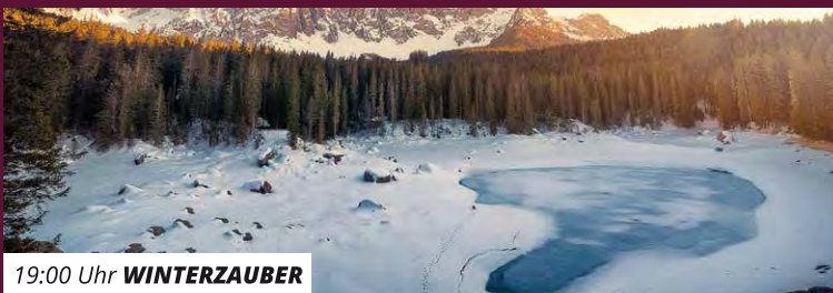
19:00 Uhr WINTERZAUBER