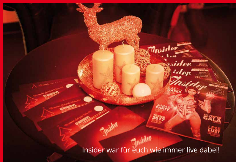
Insider war für euch wie immer live dabei!