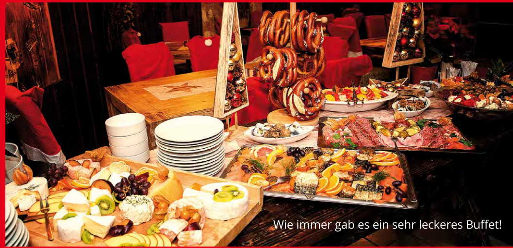
Wie immer gab es ein sehr leckeres Buffet!