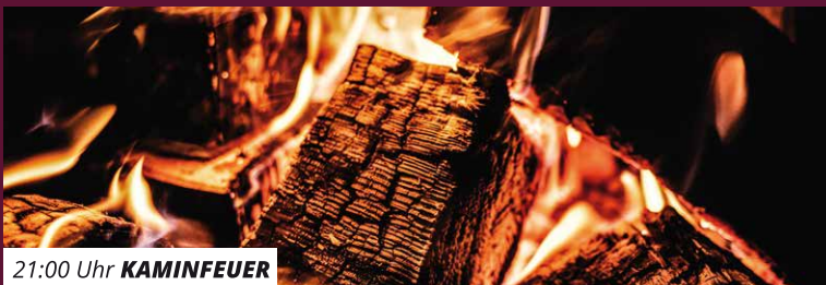
21:00 Uhr KAMINFEUER