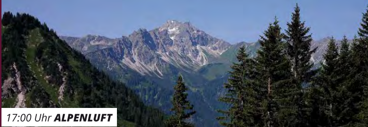
17:00 Uhr ALPENLUFT