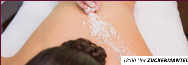
18:00 Uhr ZUCKERMANTEL