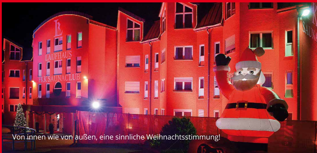
Von innen wie von außen, eine sinnliche Weihnachtsstimmung!