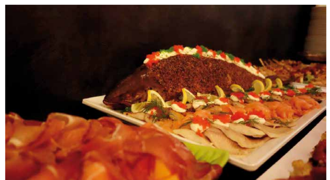
Für jeden Geschmack etwas dabei: Das üppige Buffet!