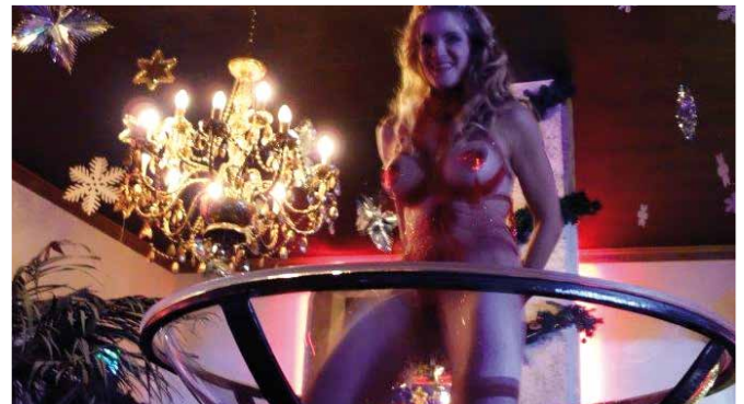
Wie Dita Von Teese in ihren besten Zeiten!