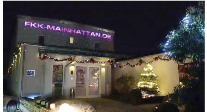
Hereinspaziert in die gute Stube!

Und spätestens dann - da sind wir uns sicher - wird sich garantiert auch der Weihnachtsmann inkognito in den FKK-Club Mainhattan begeben!